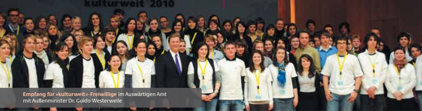
Empfang für »kulturweit«-Freiwillige im Auswärtigen Amt mit Außenminister Dr. Guido Westerwelle

GRUSSWORT VON DR. GUIDO WESTERWELLE, BUNDESMINISTER DES AUSWÄRTIGEN